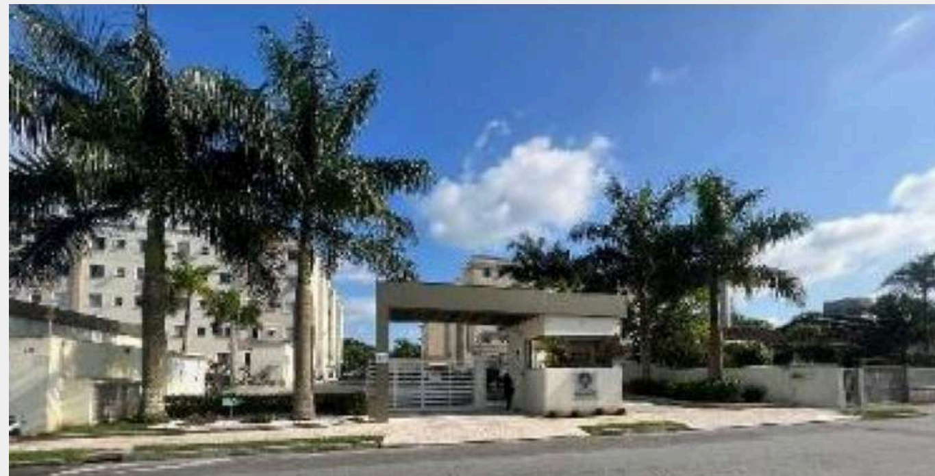
Res. Parque Luxemburgo