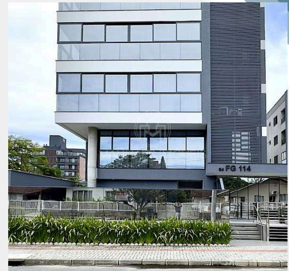
Ed. FG 114