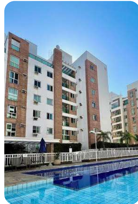
JARDINS HOME CLUB