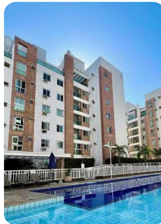
JARDINS HOME CLUB