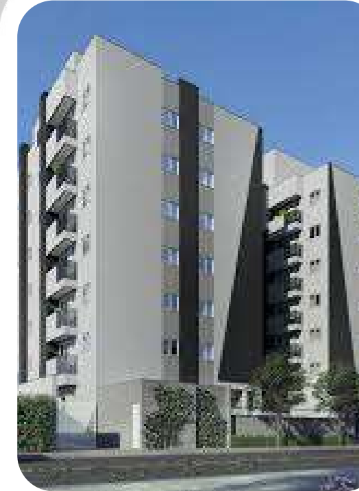
HOME CLUB SAGUAÇU